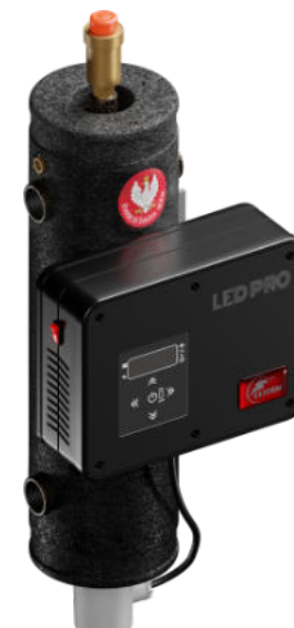
Bosman LED PRO