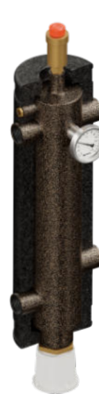
Strzelec Strzelec PRO