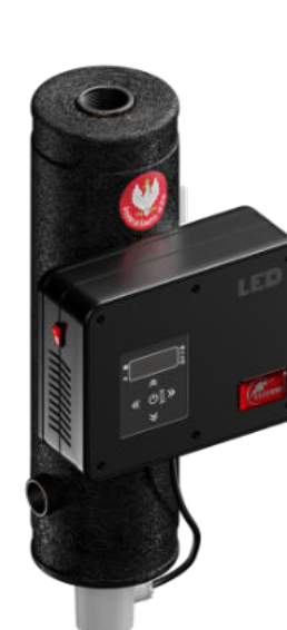
Bosman LED Bosman PC