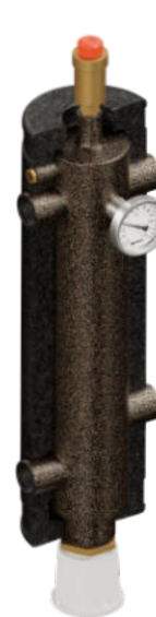
Strzelec Strzelec PRO