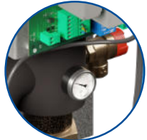
Zawór bezpieczeństwa, termomanometr