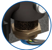
Grzałka elektryczna 3/6/9/12 kW