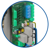
Wielofunkcyjny układ sterujący