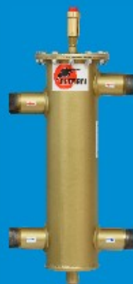
50/100 do 70kW