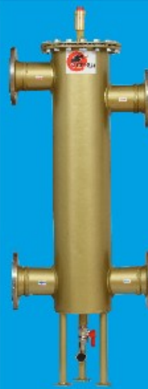
65/150 do 140kW