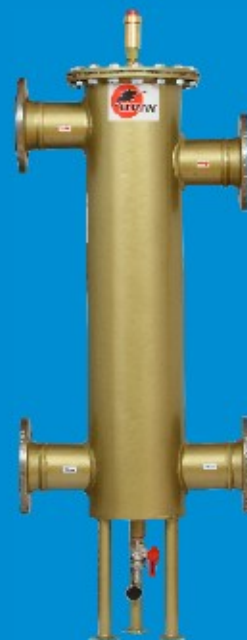
80/200 do 209kW

snadné čištění odnímatelná odlučovače vzduchu, z nerezové ocelí