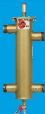
40/100 do 60kW