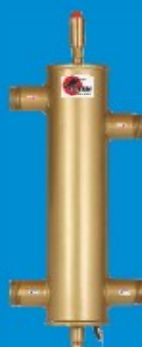
40/100 do 100kW