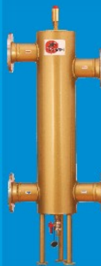
65/150 do 225kW