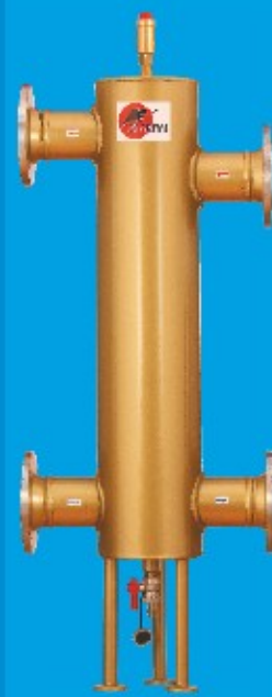
80/200 do 420kW