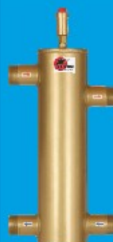
50/100 do 115kW